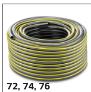
72, 74, 76