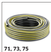
71, 73, 75