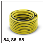
84, 86, 88