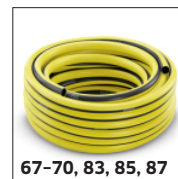
67-70, 83, 85, 87